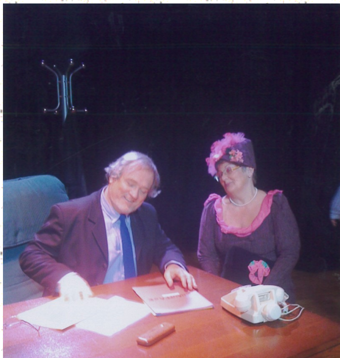
« La Preuve par Quatre »

Spectacle réservé aux enfants des écoles