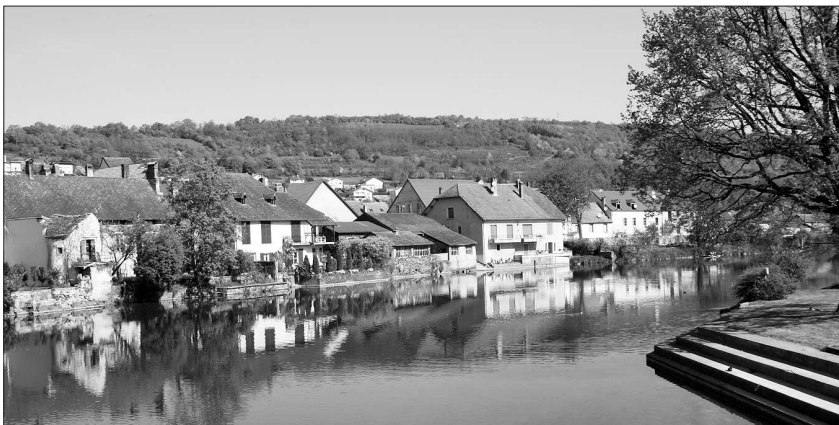
Quingey est réputée pour son cadre de vie.

Et en plus Quingey sait recevoir avec son camping trois étoiles de soixante-quinze emplacements, son gîte et ses chambres d'hôtes «très prisées», un hôtel