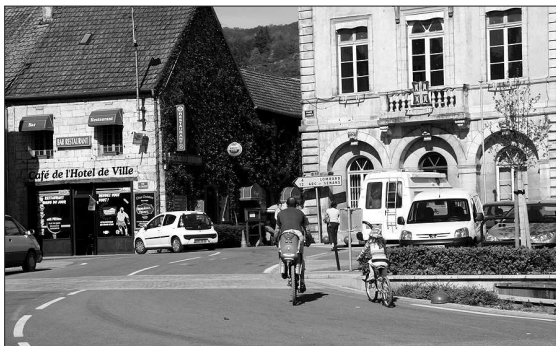
Tous les services sont proposés à la population.

Baigné par la Loue et idéalement situé, ce bourg-centre offre une réelle qualité de vie.