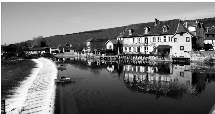
La Loue fait le bonheur des pêcheurs, des sportifs et des marcheurs contemplatifs.